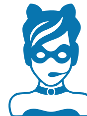
Операторы со сверхспособностями

Общение – их конек, и они владеют всеми способами работы с возражениями покупателей.