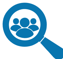
Специалисты отдела качества

Подберет оптимальный тарифный план, закроет все вопросы с документами и подключит Ваш проект.