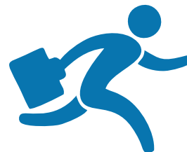
Менеджеры по продажам

Все ваши пожелания и требования будут соблюдены в точности.