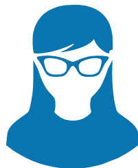
Специалист коммерческой службы

На всё время Вашего проекта за Вами будет закреплён куратор, который поможет Вам в решении любых вопросов.